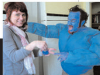
BLU DIPINTO DI BLU Sopra, La Bestia-Hulk entra nella parte con la povera truccatrice prima del ciak

l'abbiamo fatto». Qual è stato il peggiore? C: «Io lavoravo su un camion, trasportavo birra e non era poi così male. Prima ho pulito anche qualche cesso. Ma non mi lamento». Influenze? Che cosa ascoltate? Canzoni che vi ispirano?